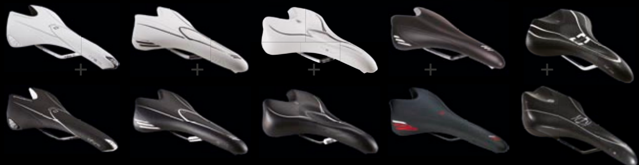
INFORM RXL VEIL. PRIS 1.290,-